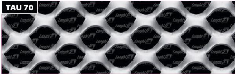
TAU 70 הרשת

ניתן להזמין את הרשת בגדלים ובעוביים שונים ניתן לכופף ולרתך את הרשת לפרופילים שונים