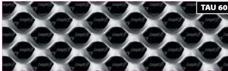
אפיון הרשת TAU 60

ניתן להזמין את הרשת בגדלים ובעוביים שונים ניתן לכופף ולרתך את הרשת לפרופילים שונים