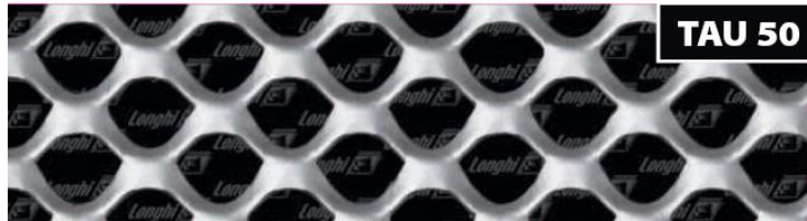
אפיון הרשת TAU 50

ניתן להזמין את הרשת בגדלים ובעוביים שונים ניתן לכופף ולרתך את הרשת לפרופילים שונים