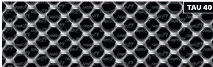
אפיון הרשת TAU 40

ניתן להזמין את הרשת בגדלים ובעוביים שונים ניתן לכופף ולרתך את הרשת לפרופילים שונים