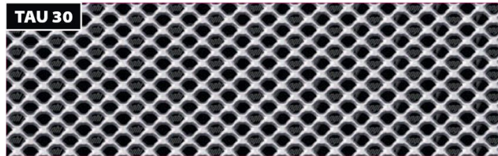
אפיון הרשת TAU 30

ניתן להזמין את הרשת בגדלים ובעוביים שונים ניתן לכופף ולרתך את הרשת לפרופילים שונים