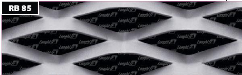
אפיון הרשת RB 85

ניתן להזמין את הרשת בגדלים ובעוביים שונים ניתן לכופף ולרתך את הרשת לפרופילים שונים