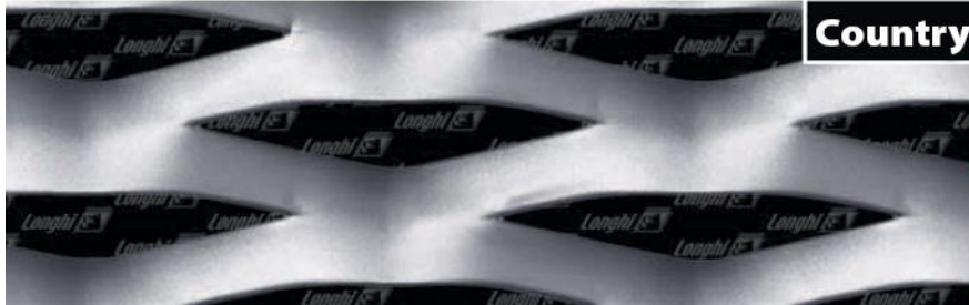
אפיון הרשת Country

ניתן להזמין את הרשת בגדלים ובעוביים שונים ניתן לכופף ולרתך את הרשת לפרופילים שונים